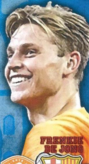
FRENKIE DE JONG

KOMEN JULLIE ONS ACHTERNA? MAAK PLEZIER EN LEER HET SPELLETJE BIJ VV STAPHORST MEER INFORMATIE VOOR OUDERS OP WWW.VVSTAPHORST.NL