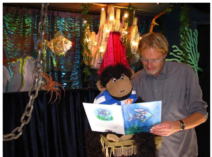
Poppenkastvoorstelling: Het mooiste visje van de zee

Er is oppas aanwezig voor kinderen van 0 tot 4 jaar. U kunt zich bij Aldert Dijk opgeven als u ons wil helpen bij deze oppas. aldert@cnsstaphorst.nl